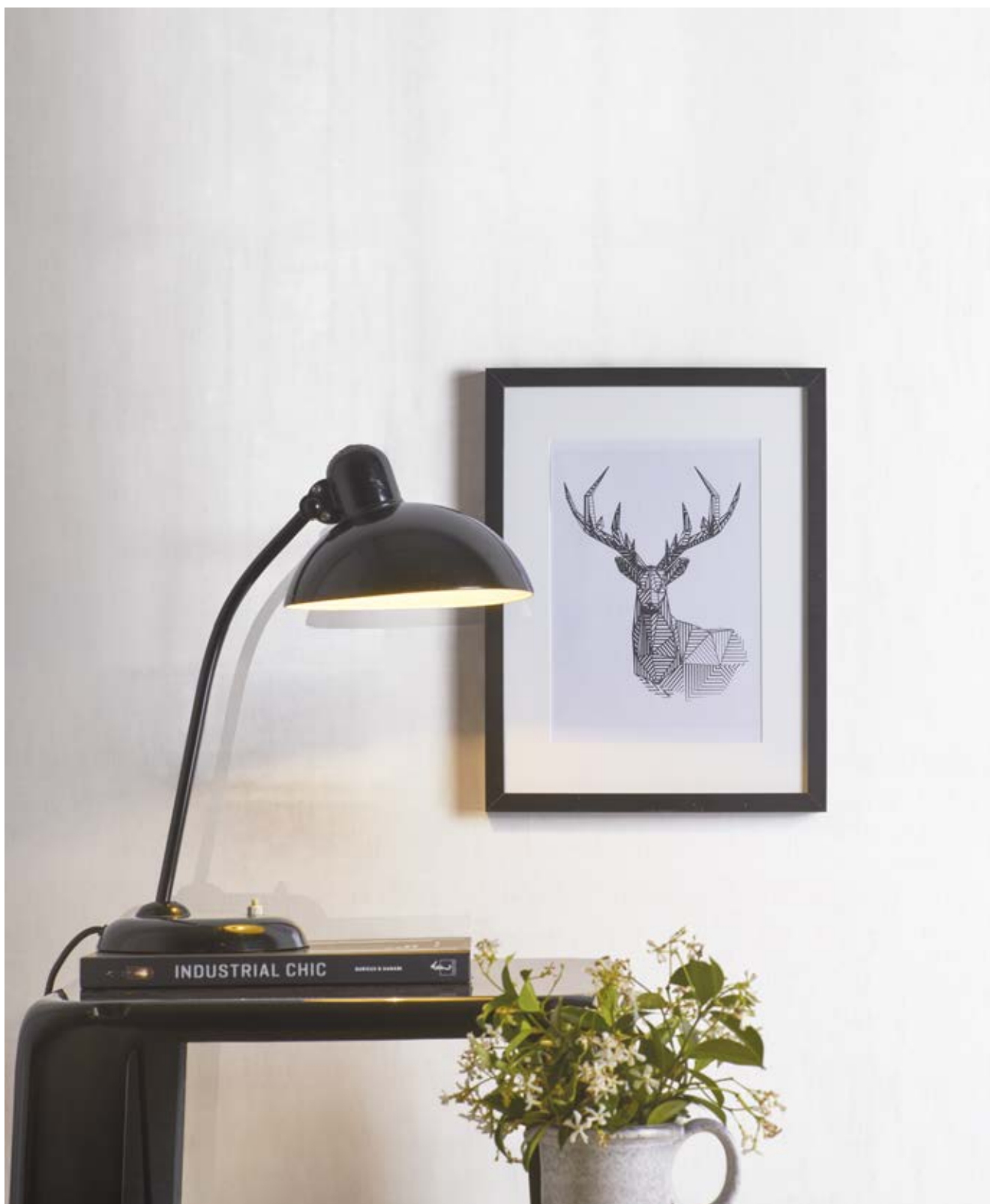
Floor & Wall Concrete Look Mud

- Gres Fine Porcellanato Colorato in Massa • Colorbody Fine Porcelain Stoneware • Grès Cérame Fin Coloré dans la Masse • Durchgefärbtes Feinsteinzeug • Gres Porcelánico Fino Coloreado en Masa • Гомогенный мелкозернистый Керамогранит